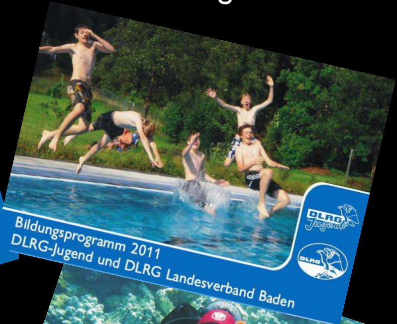
Bildungsprogramm 2011 DLRG-Jugend und DLRG Landesverband Baden