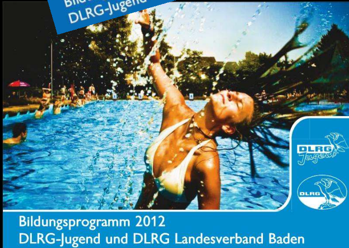
Bildungsprogramm 2012 DLRG-Jugend und DLRG Landesverband Baden