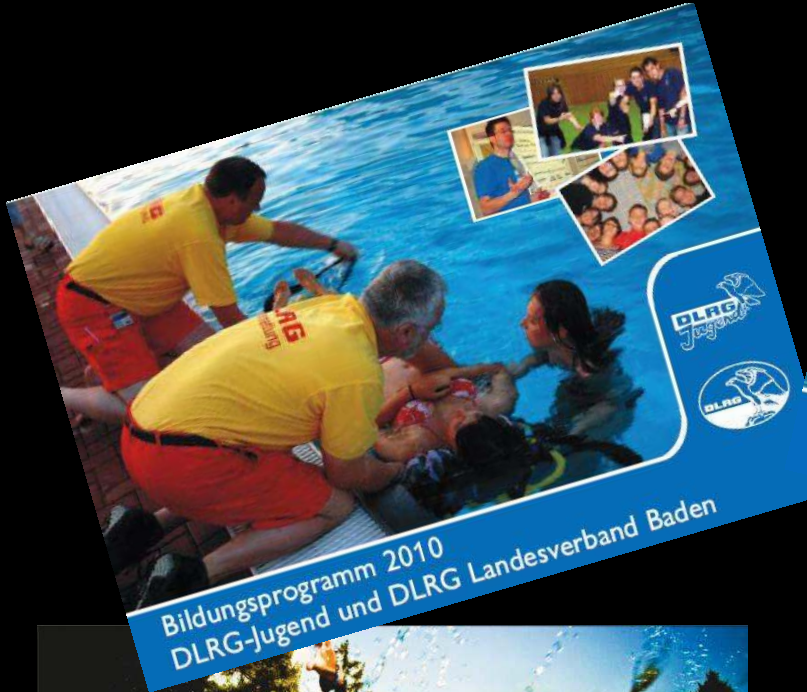
Bildungsprogramm 2010 DLRG-Jugend und DLRG Landesverband Baden