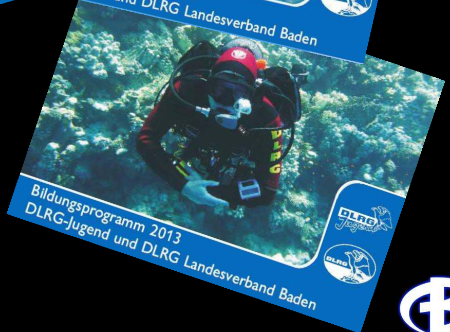
Bildungsprogramm 2013 DLRG-Jugend und DLRG Landesverband Baden